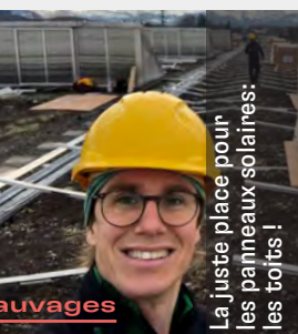
La juste place pour les panneaux solaires: les toits!

316 reportages (+175) 204 reportages (+131) 39 reportages (+14)