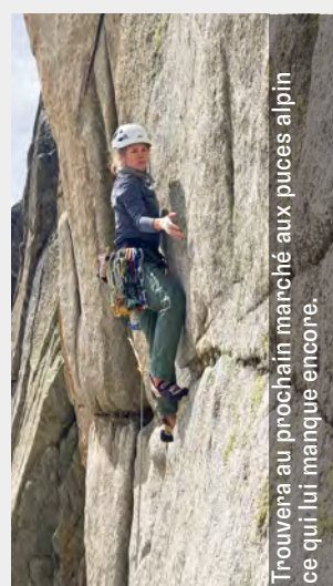
Trouvons au prochain marché aux puces alpin ce qui lui manque encore.

Je viens de découvrir le clean climbing. Alors que jusqu'à présent je faisais confiance au matériel existant sur le rocher, je dois maintenant aussi me fier à mes capacités, comme la pose de l'assurage mobile. Je peux sans doute encore travailler sur ma confiance en moi. Ce dont je suis certaine, c'est que j'aime évoluer de manière à laisser le moins de traces possible. Ce qui me manque, par contre, c'est du bon matériel: mais je trouverai sans doute ce qu'il me faut lors du prochain marché aux puces alpin. Si la dernière fois je n'ai pas trouvé tout ce qu'il me fallait, j'ai rencontré de manière inattendue des visages familiers et ai fait la connaissance de nouvelles personnes. Rien que pour cet échange, cela valait la peine d'être présente.