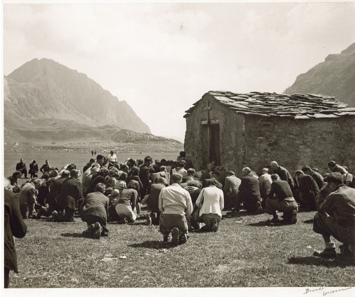
Letzte Messe in der alten Kapelle von Salanfe kurz vor Einlaufen des Wassers, ca. 1950.