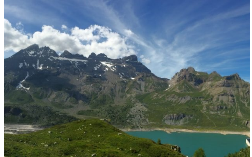
Staumauer und Stausee Salanfe. https://salanfe.ch/de/salanfe-entdecken/staumauer-salanfe/ ; 20.11.2022