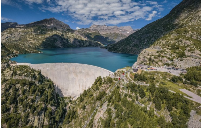
Staumauer und Stausee Emosson. https://www.valleedutrient.ch/fr/visite-guideee-du-barrage-d-emosson-fp591 ; 20.11.2022.