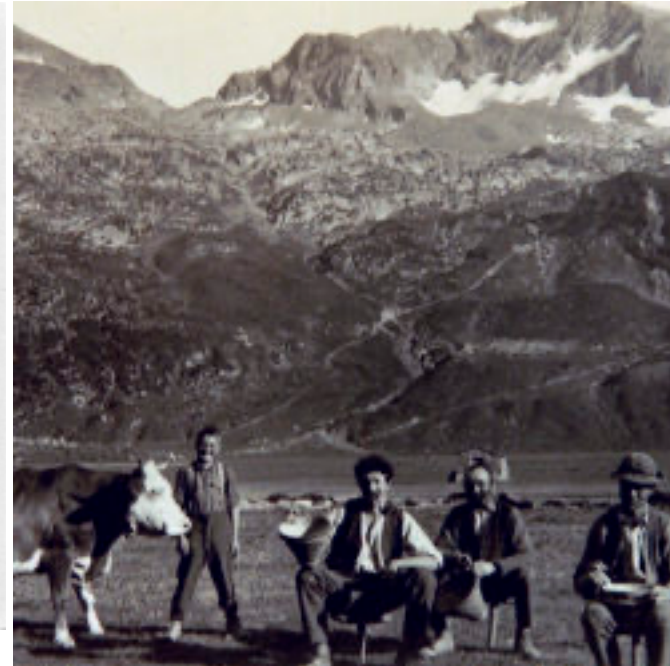
Gruppe von Bauern. Petit historique de Salanfe. https://salanfe.ch/de/salanfe-entdecken/geschichtlicher-ueberblick/