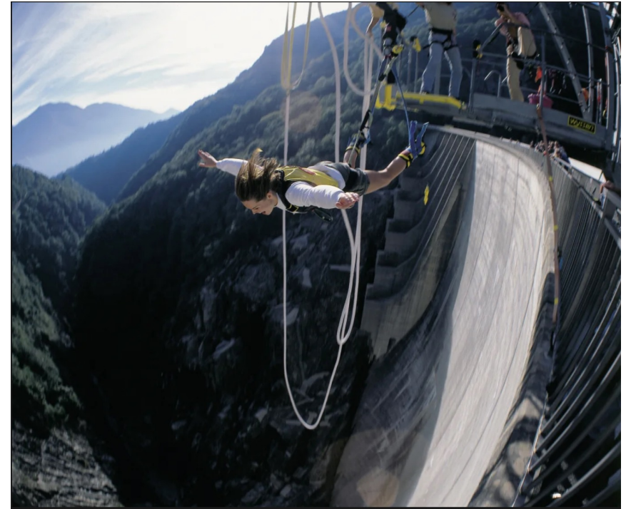
Sprung von der Staumauer in Contra, ca. 2015.