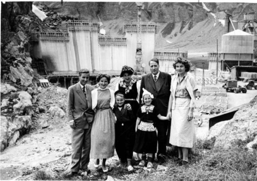
Sonntagsausflug zur Baustelle, Emosson, zwischen 1967-1973