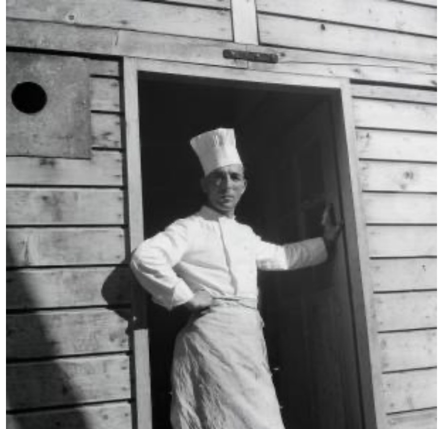
Koch beim Staudammbau des Lac de la Gruyère. © Ernst Brunner, SGV_12N_26071