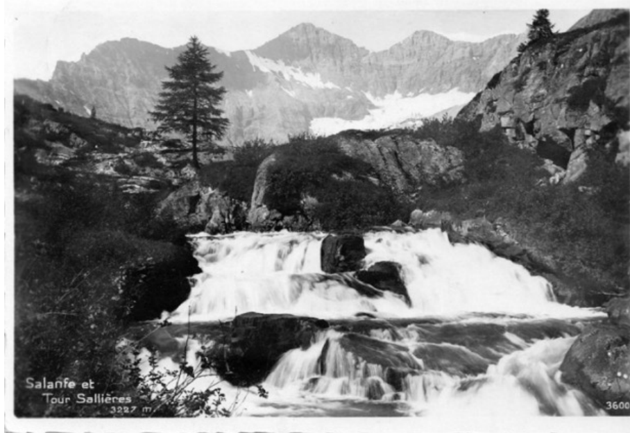
Postkarte, Salanfe/Tour Sallièrre, 1920.