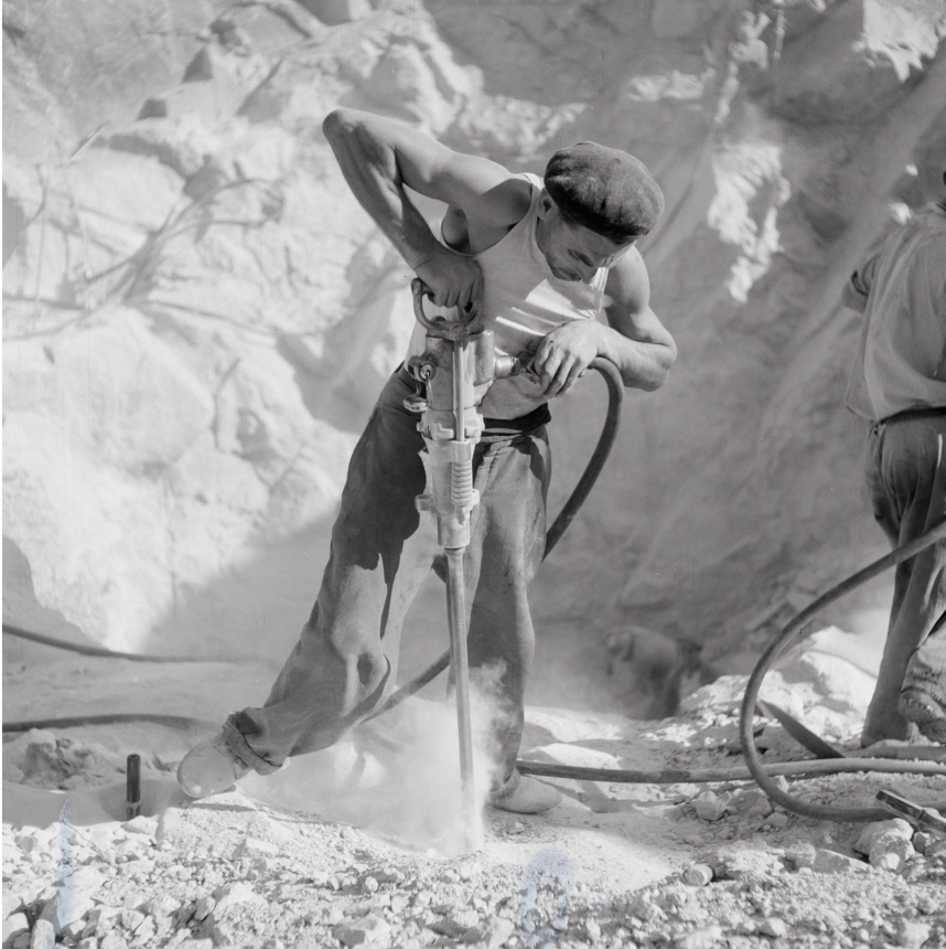
Bauarbeiten für den Stausee Pfaffensprung (UR), ca. 1921.