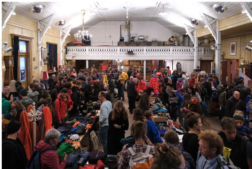
Ein Alpinflohmarkt im «Heitere Fahne» in Wabern bei Bern am 27. Oktober 2021.